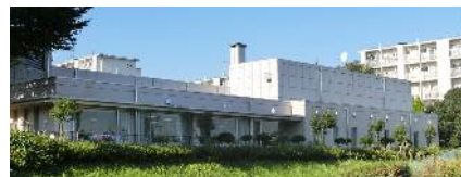
福祉避難所 ひかりが丘地域ケアプラザ

福祉避難所は地域防災拠点や自宅で生活す ることが困難な方のための避難所です。 区役所が本人の状況などを確認し、福祉避難 所への避難の必要性を判断します。